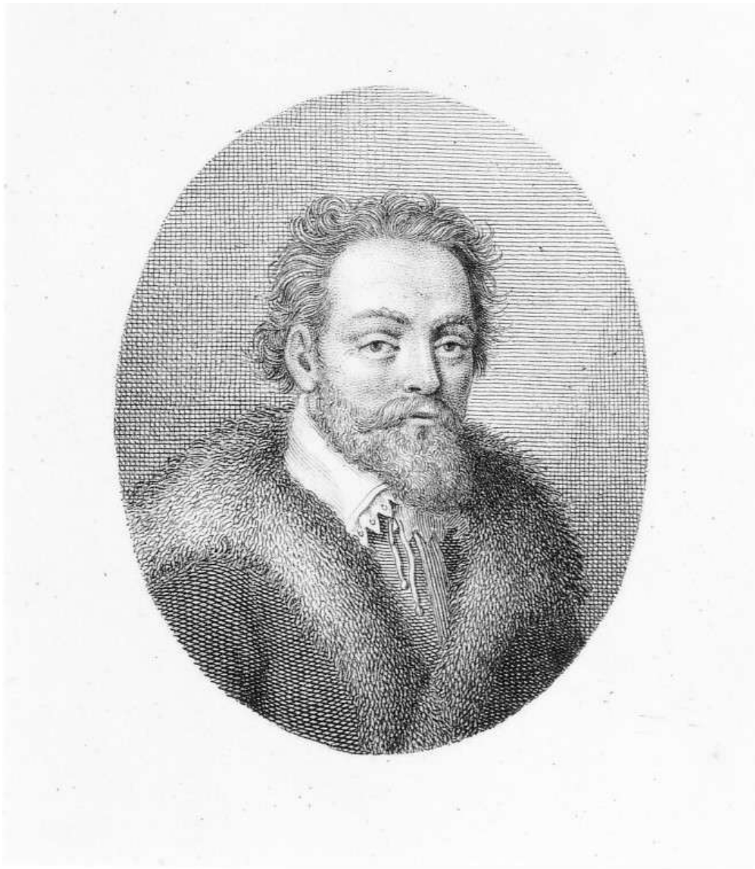
Portret Cornelis Drebbel 18de eeuw Anoniem Nederlands Prent papier 50 x 40 mm